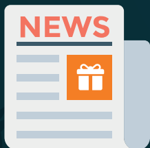
Zeitschriften & Zeitungen