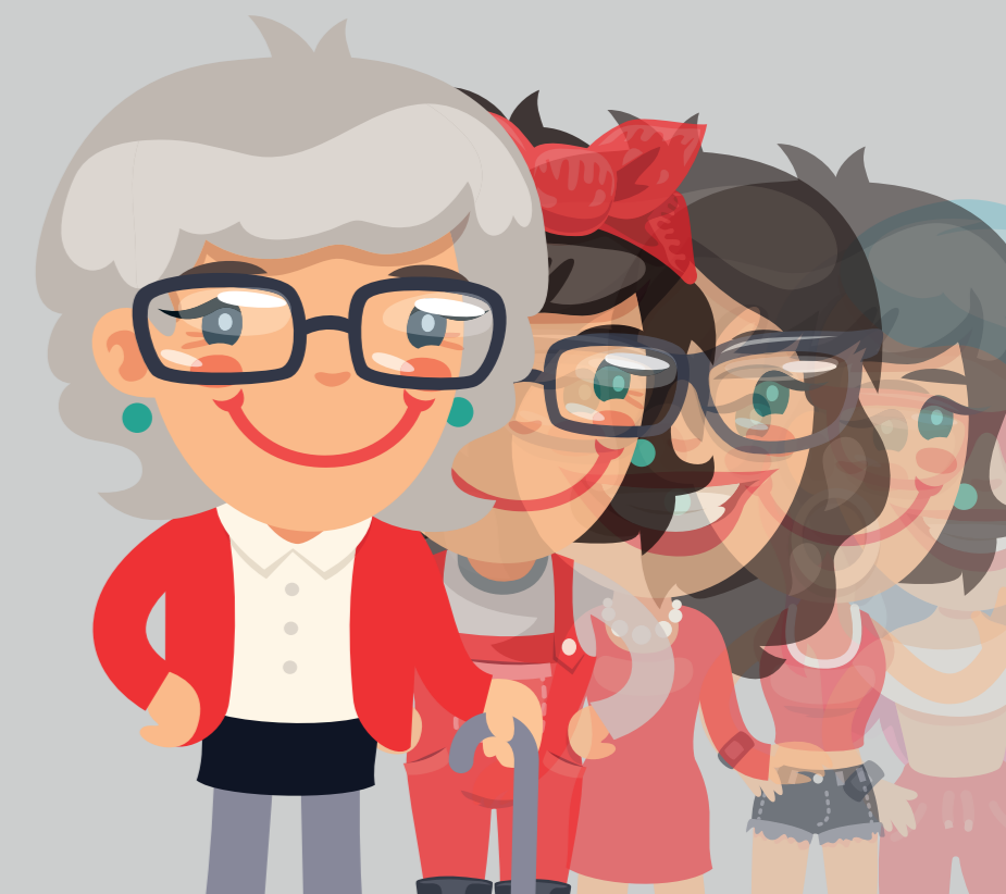
ZEITVERLAUF: Anteil der Onliner der jeweiligen Altersgruppe, die Facebook/Instagram nutzen

Zulauf von älteren Nutzern kann die Verluste vor- erst noch ausgleichen. Das verschleiert das dro- hende Schicksal: Erst überaltern, dann schrumpfen.